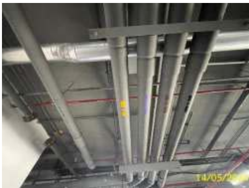
ท่อระบายน้ำเสีย

2. ระบบระบายน้ำภายนอกอาคาร เป็นในลักษณะรางระบายน้ำที่ทำหน้าที่รองรับฝนที่ตกบริเวณชั้นล่างที่อยู่นอกอาคารและมีหน้าที่รับน้ำฝนจากระบบท่อแนวดิ่งจากอาคาร การระบายน้ำฝนของพื้นที่โครงการทั้งหมดเป็นท่อคอนกรีตเสริมเหล็ก สำหรับเป็นช่องตรวจสอบการระบายน้ำและให้น้ำฝนไหลเข้าท่อระบายน้ำ สำหรับน้ำทิ้งที่ผ่านการบำบัดจนมีคุณภาพเป็นไปตามค่ามาตรฐานแล้วจะระบายน้ำทิ้งไปยังบ่อตรวจคุณภาพน้ำหลังบำบัดและมีบ่อพักน้ำ (Manhole) ซึ่งจัดให้มีบ่อพักน้ำเป็นระยะ ๆ จากนั้นจึงระบายลงสู่ท่อระบายน้ำสาธารณะต่อไป