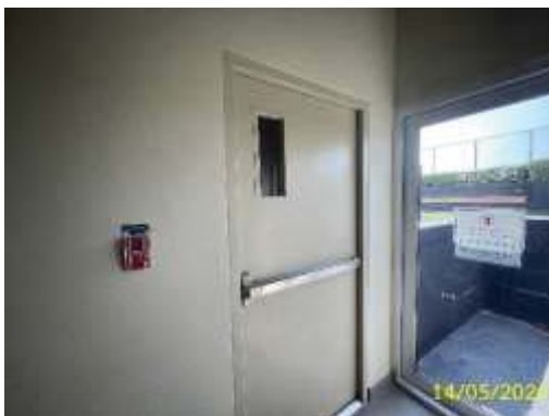
ประตูหนีไฟ