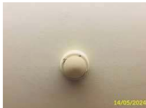
อุปกรณ์ตรวจจับควัน (Smoke Detector)