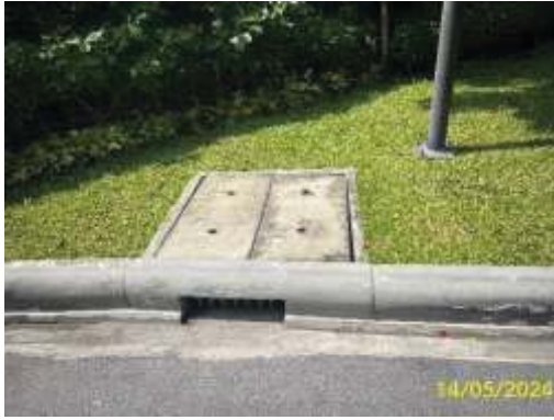
บ่อตรวจสอบการระบาย