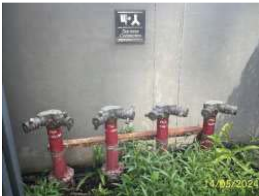
หัวรับน้ำดับเพลิง