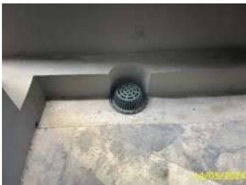
ท่อระบายน้ำฝนในอาคาร