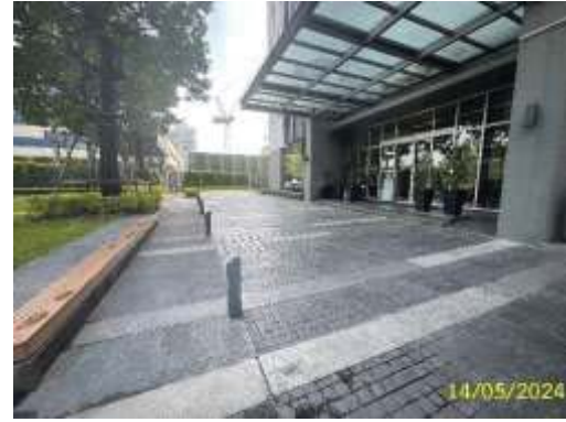
ภาพที่ 1.3.10-1 (ต่อ) ระบบรักษาความปลอดภัย และระบบป้องกันอัคคีภัย