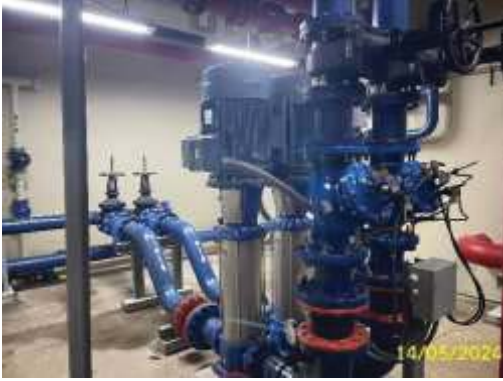
เครื่องสูบน้ำ (Cold Water Pump)