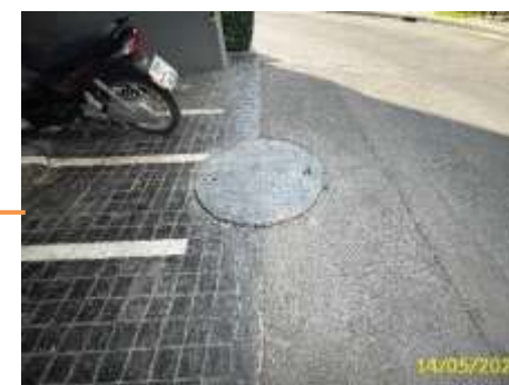
ถังถังไขมัน