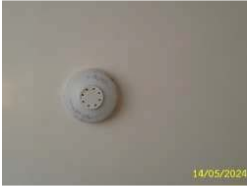
อุปกรณ์ตรวจจับความร้อน (Heat Detector)