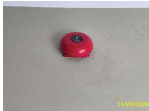
กระดิ่งสัญญาณ (Fire Alarm Bell)