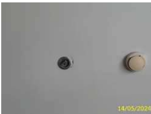
หัวกระจายน้ำดับเพลิง