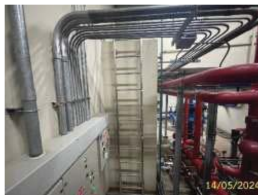
ถังสำรองน้ำชั้นใต้ดิน