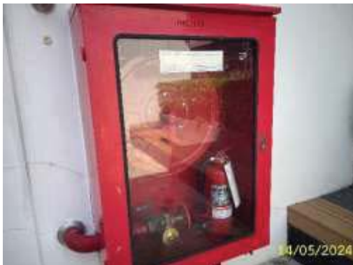
ตู้เก็บสารฉีดน้ำดับเพลิงและอุปกรณ์