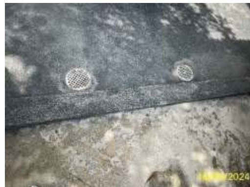
หัวรับน้ำฝนบนอาคาร