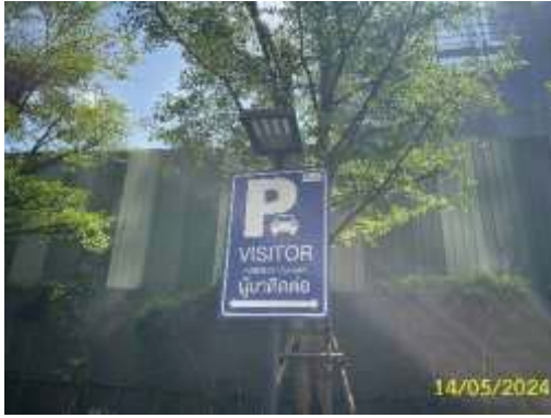
ป้ายพื้นที่จอดรถผู้มาติดต่อ (VISITOR)