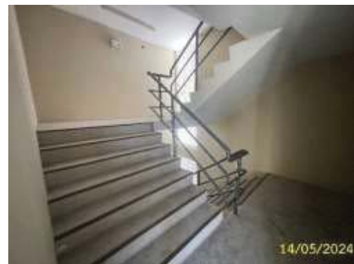
บันไดหนีไฟ