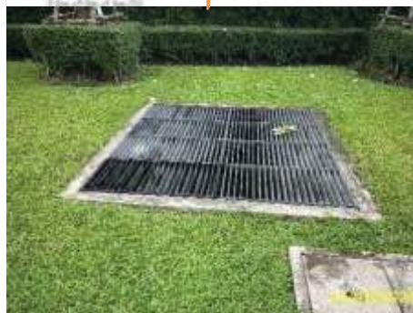
บ่อตรวจคุณภาพน้ำ