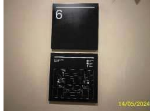
แผนผังแสดงเส้นทางหนีไฟและอุปกรณ์