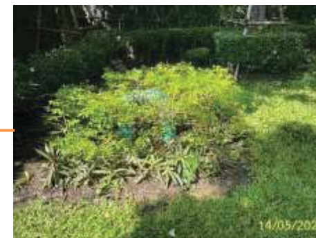
บ่อกำจัดก๊าซมีเทน