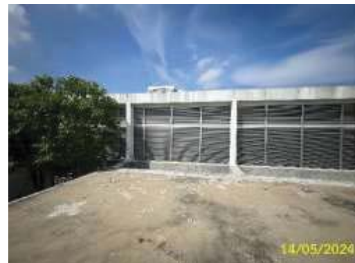
พื้นที่หนีไฟทางอากาศ