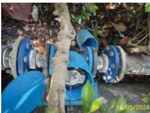
มิเตอร์น้ำประปา

โครงการจัดให้มีระบบการจ่ายน้ำใช้ โดยจะต่อท่อรับน้ำประปาจากท่อเมนของการประปานครหลวงบริเวณริมถนนรัชดาภิเษกผ่านมิเตอร์น้ำและท่อประปาขนาด เส้นผ่านศูนย์กลาง 4 นิ้ว ไปเก็บกักไว้ในถังเก็บสำรองน้ำใต้ดิน จำนวน 1 ถัง ความจุ 564 ลูกบาศก์เมตร สำหรับระบบประปาของอาคารจะถูกสูบโดยปั๊มส่งน้ำประปา (Cold Water Pump) ควบคุมด้วยระบบอัตโนมัติ จำนวน 2 ชุด สลับการทำงานเมื่อใช้งานปกติ ส่งน้ำขึ้นไปเก็บไว้ในถังสำรองน้ำบนหลังคา ความจุ 100 ลูกบาศก์เมตร ด้วยท่อประปาขนาด เส้นผ่านศูนย์กลาง 6 นิ้ว จากนั้นจะกระจายน้ำลงสู่ชั้น 6-38 ด้วยอาศัยแรงโน้มถ่วงของโลก (Gravity Flow) ซึ่งโครงการจะติดตั้งปั๊มระบบถังอัดแรงดัน (Booster Pump) จำนวน 3 ชุด สำหรับจ่ายน้ำจากชั้นดาดฟ้าสู่ชั้นพักอาศัยในส่วนต่าง ๆ