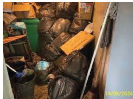
ห้องพักขยะรวม