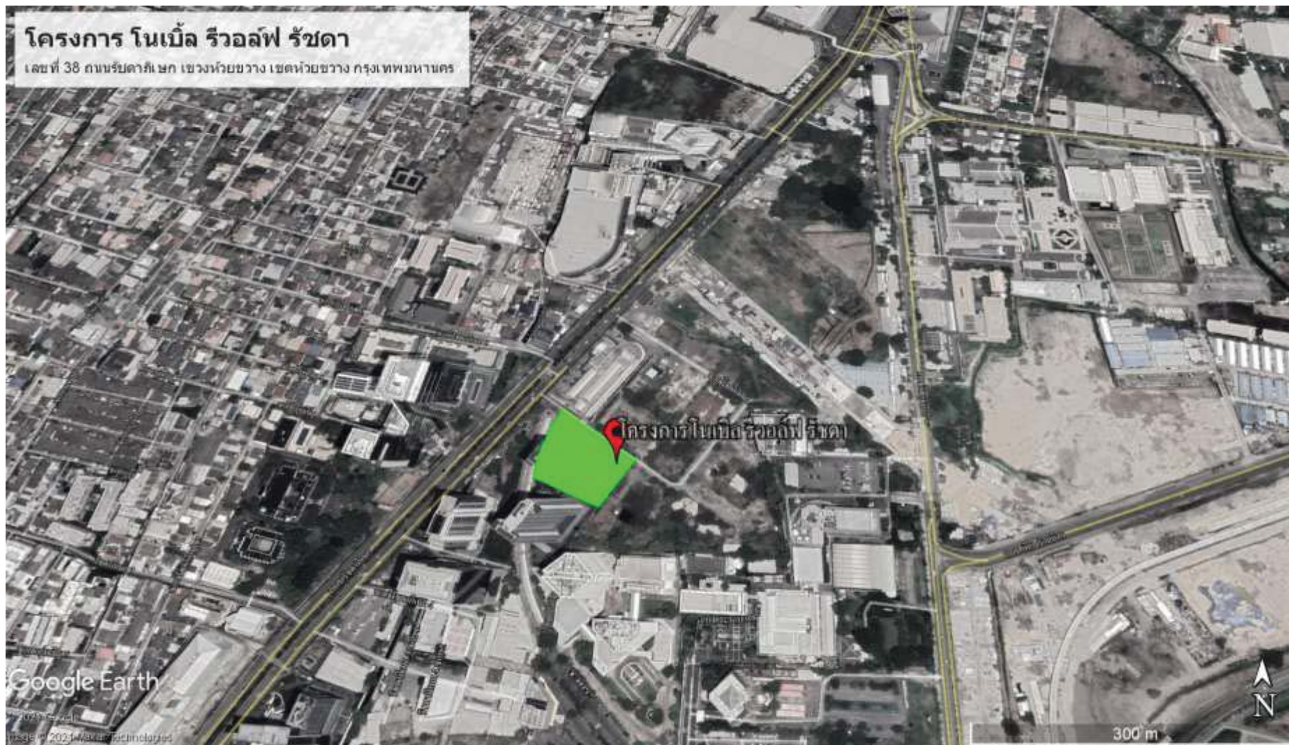
ภาพที่ 1.2-1 ที่ตั้งโครงการ