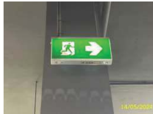
ป้ายบอกทางหนีไฟ