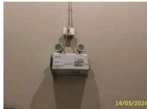
ระบบไฟฟ้าฉุกเฉิน