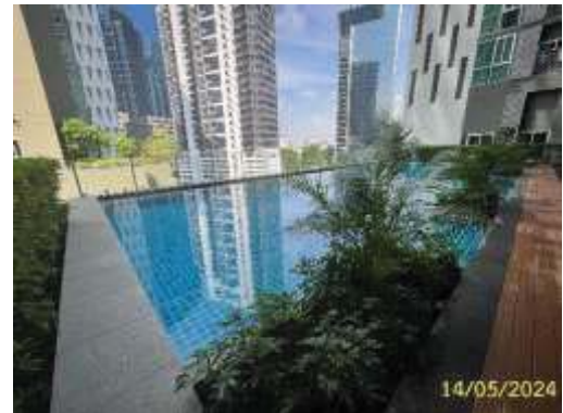
ภาพที่ 1.2-2 สภาพปัจจุบัน