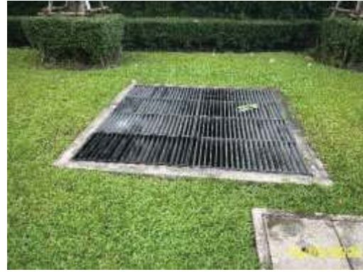
บ่อพักน้ำ (Manhole)