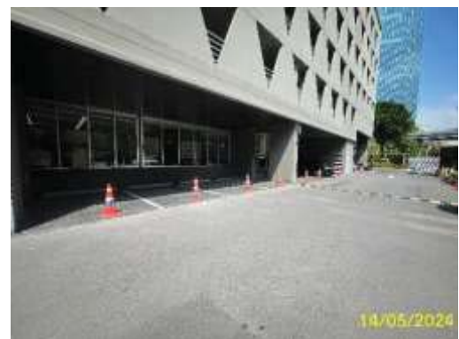
พื้นที่จอดรถผู้มาติดต่อ (VISITOR)