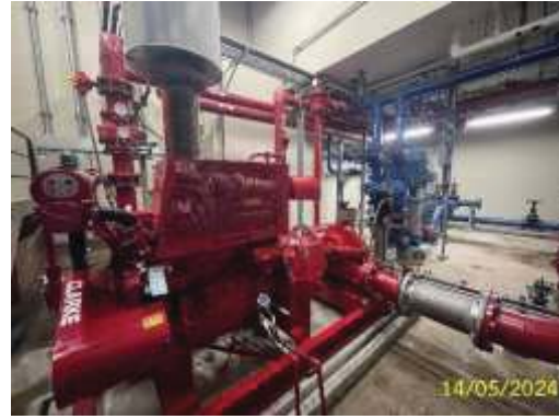
เครื่องสูบน้ำดับเพลิง