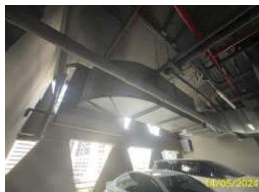
ภาพที่ 1.3.9-1 ระบบระบายอากาศ และระบายอากาศ