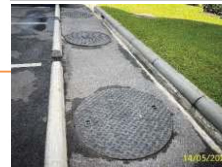
ถังปรับสมดุลและถังเติมอากาศ