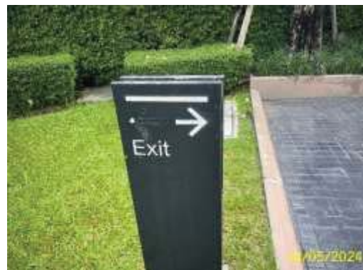
ป้ายสัญลักษณ์และทิศทางการจราจร