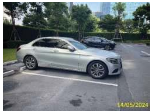
พื้นที่จอดรถ