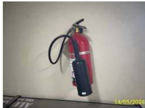
ถังดับเพลิงมือถือ