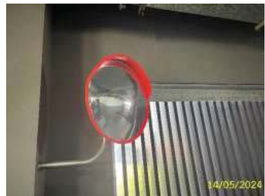
ป้ายสัญลักษณ์และทิศทางการจราจร