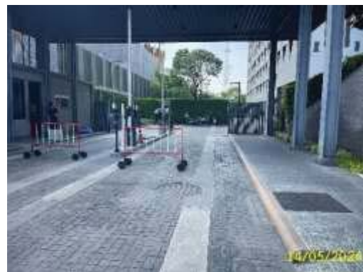
ทางเข้า-ออกพื้นที่โครงการ