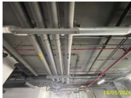
ภาพที่ 1.3.4-1 ระบบระบายน้ำเสียและสิ่งปฏิกูล