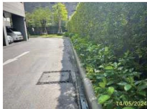
รางระบายน้ำฝนรอบอาคาร