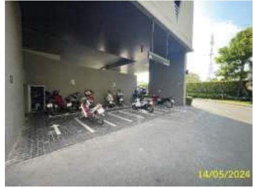
พื้นที่จอดรถจักรยานยนต์