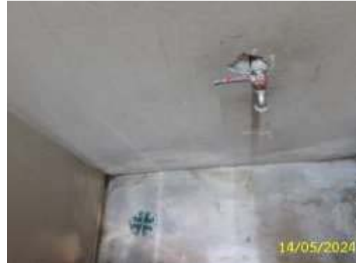
ห้องพักมูลฝอยประจำชั้นพักอาศัย