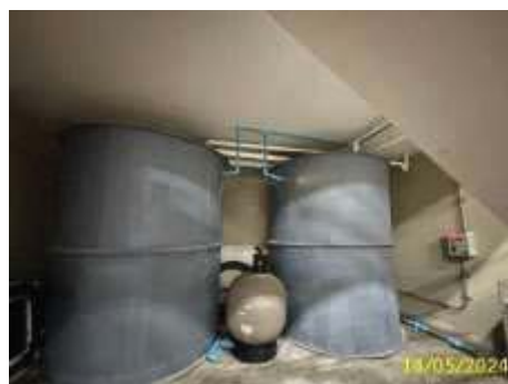
ถังถังละอองฝอย (Aerosol)