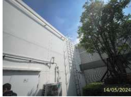
ถังสำรองน้ำชั้นดาดฟ้า