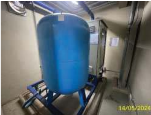
ปั๊มระบบถังอัดแรงดัน (Booster Pump)