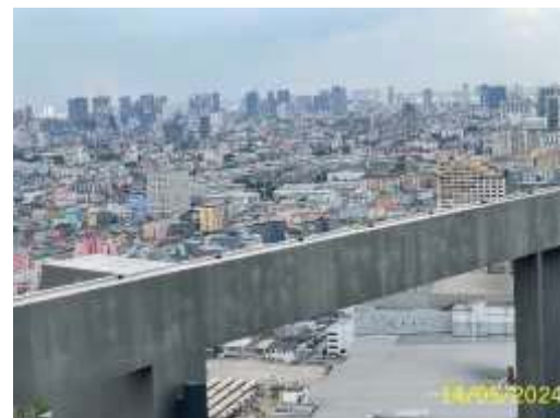
ระบบป้องกันฟ้าผ่า