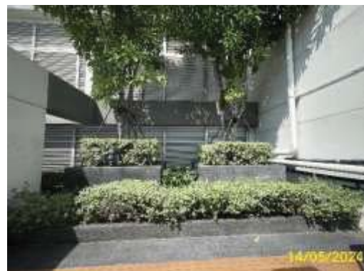
พื้นที่สีเขียวชั้นดาดฟ้า