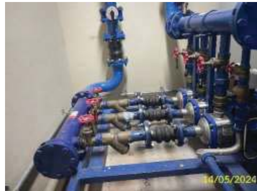
ภาพที่ 1.3.3-1 (ต่อ) ระบบน้ำใช้