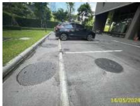
บ่อพักน้ำทิ้ง