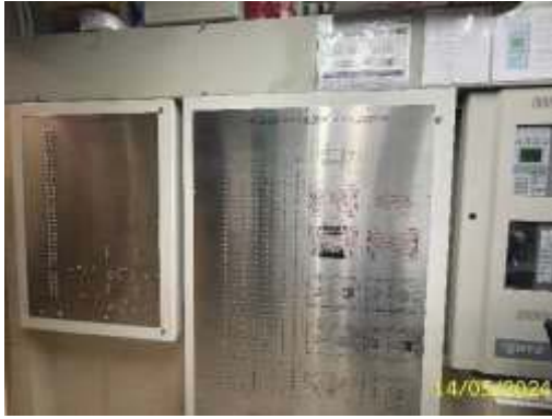
แผงควบคุม (Fire Alarm Control Panel)