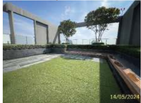
พื้นที่สีเขียวชั้นที่ 38