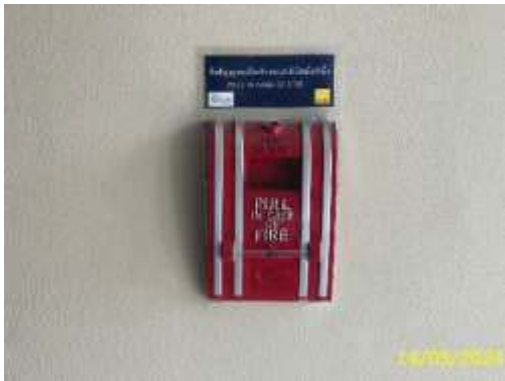
เครื่องแจ้งเหตุโดยใช่มือดึง