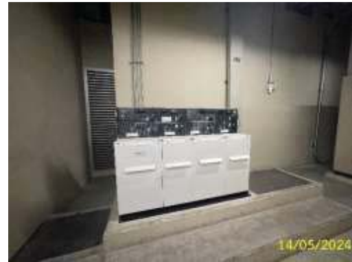
ระบบไฟฟ้าปกติ